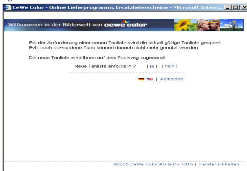
Abbildung 7: Bestätigungsdialog TAN Verwaltung

Wenn Sie über die [start] Links eine neue TAN Liste anfordern oder die aktuelle TAN Liste sperren lassen, wird in beiden Fällen eine weitere Seite angezeigt, auf der Sie Ihre Auswahl erneut bestätigen müssen.