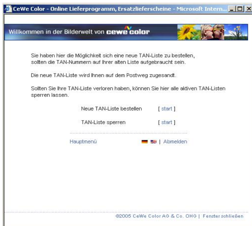
Abbildung 6: TAN Verwaltung

Wenn Sie über die [start] Links eine neue TAN Liste anfordern oder die aktuelle TAN Liste sperren lassen, wird in beiden Fällen eine weitere Seite angezeigt, auf der Sie Ihre Auswahl erneut bestätigen müssen.